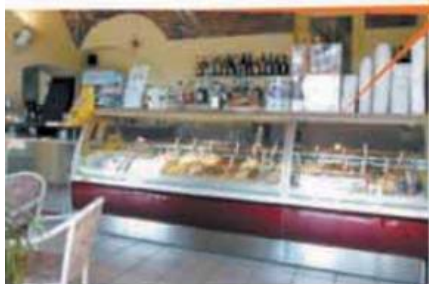
Bar Gelateria GELMO Loano (SV)