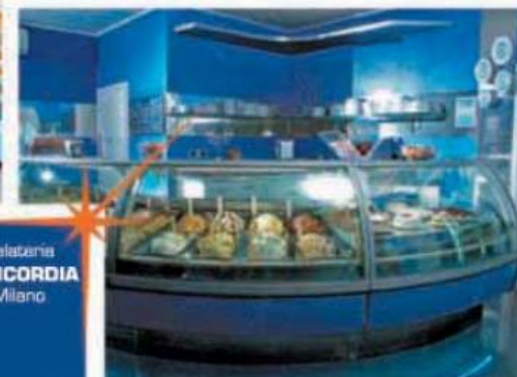
Gelateria CONCORDIA Milano