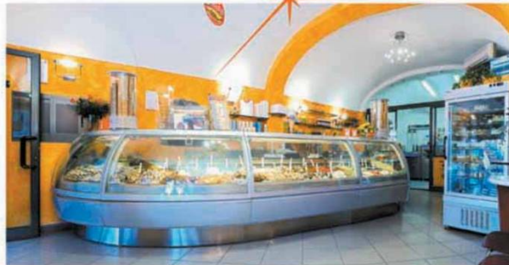
Gelateria DARIO Loano (SV)