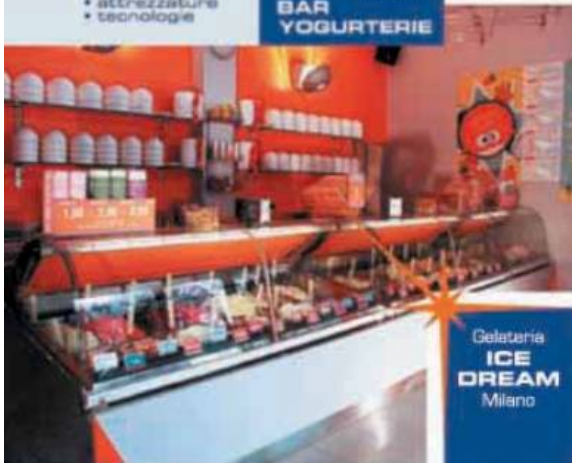
Gelateria ICE DREAM Milano